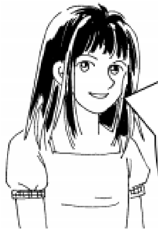
1-ый участник разговора

Вот часть разговора между двумя людьми, прочитавшими басню «Скупой и его золото».