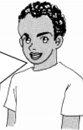
2-ой участник разговора

Нет, нельзя. Для этой истории важен именно камень.